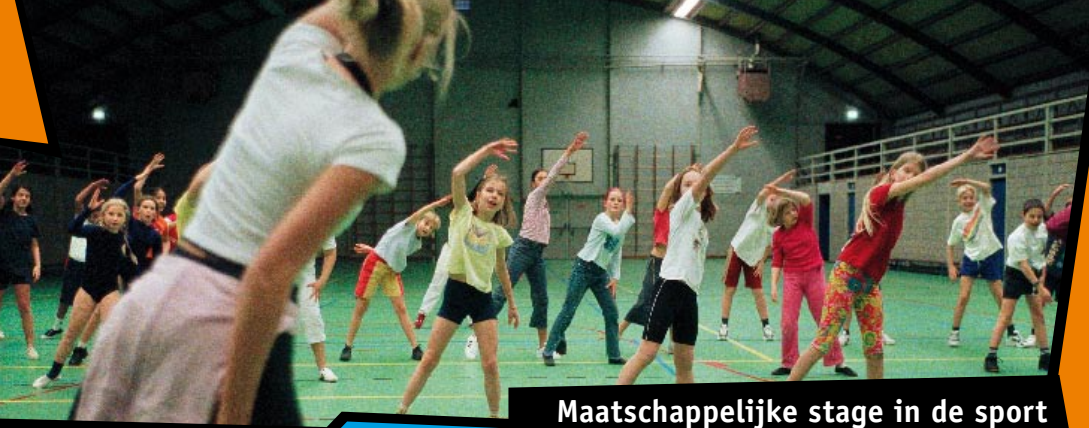
Maatschappelijke stage in de sport